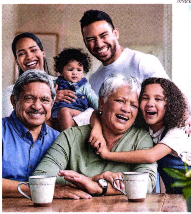
Población. Envejece y con menor tasa de natalidad, por lo que será menos probable que padres reciban apoyo de hijos al jubilarse.

que los sistemas de reparto, como la ONP, en la medida en que la población envejece, son difíciles de mantener.