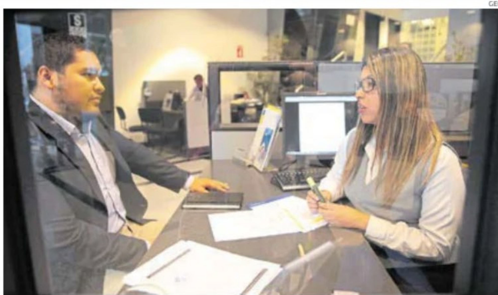
Liberações. Los siete retiros previos afectan la composición de las carteras de las administradoras.

Los fondos de pensiones no están preparados, por estructura, para ser líquidos, pues son inversiones para el largo plazo, pero se han realizado ocho retiros de esos recursos en cuatro años que han golpeado significativamente la conformación de las carteras y es necesario hacer ajustes,